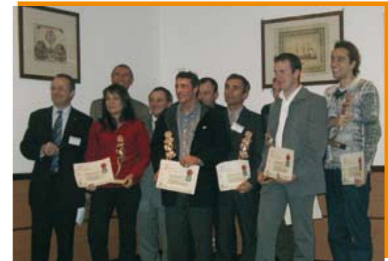
Les récompensés 2004